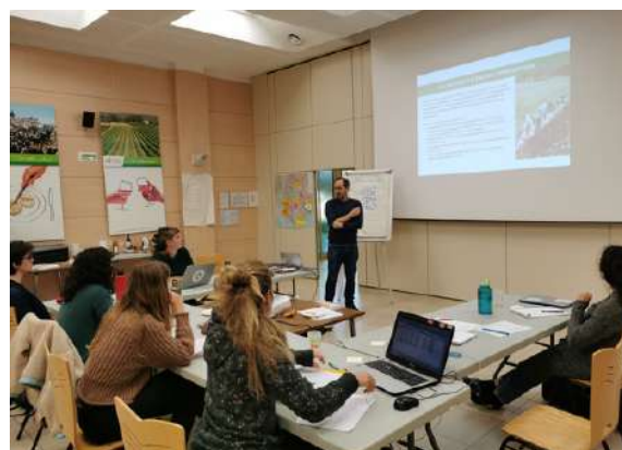
Formation à destination de techniciens du réseau engagés dans le Pacte en faveur de la haie - Octobre 2024

En 2024, le GR CIVAM PACA a initié avec un consortium de 7 structures des réseaux Bios et Adear un travail de montée en compétences sur l'accompagnement à la plantation et à la gestion des projets de haies et d'agroforesterie, pour démultiplier les capacités d'accompagnement sur le territoire, et au vu de la demande croissante des agriculteurs. Ce consortium s'appuie sur la coordination du GR CIVAM, en lien avec la Scop Agroof, partenaire historique de l'association et membre associé de l'APAM. Des outils de suivis des demandes d'agriculteurs, des temps de formation et d'échanges collectifs, des visites de fermes et des outils d'aide à l'accompagnement des agriculteurs ont été mis en place. La première formation du collectif a eu lieu en octobre 2024 à Aix en Provence, et se poursuit début 2025 par d'autres temps collectifs.