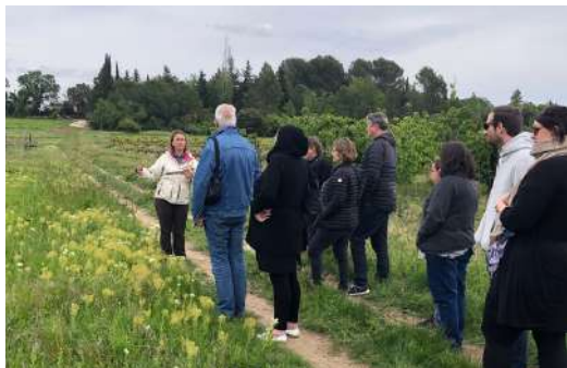
Accueil collectif, avril 2024

Parc Naturel Régional du Ventoux : depuis la création du réseau, les membres du territoire du Ventoux interviennent et accueillent des scolaires dans le cadre de l'appel à projet "Eco-citoyenneté et solidarité à l'école, au collège et au lycée" porté par le Parc Naturel Régional du Mont-Ventoux auprès des établissements scolaires du territoire du Parc. En 2024, le réseau accuse une baisse d'actions avec seulement 13 demi-journées réalisées contre 38 l'année précédente. Les perspectives s'annoncent peu favorables pour la reconduction de ces actions en raison des coupes budgétaires régionales.