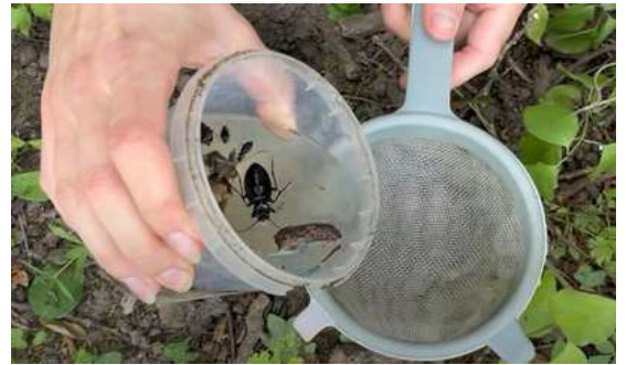
Piégeage et identification des auxiliaires capturés en parcelles agroforestières, projet CLIMAF

Dans le cadre du projet CLIMAF coordonné par Arvalis-Institut du Végétal, un nouveau stage en 2024 a poursuivi les travaux menés depuis 2020 sur les parcelles agroforestières céréalières, afin de mieux comprendre les dynamiques de présence de certains auxiliaires (carabes, araignées, staphylins) dans les parcelles, en fonction des distances des arbres et du type d'agroforesterie. Manoël Seignon (stagiaire M2) a réalisé mensuellement un suivi sur 5 fermes et inventorié l'ensemble des auxiliaires piégés. Les résultats ont été présentés à la restitution du projet CLIMAF, reportée à début 2025 (une cinquantaine de participants, le 6 mars 2025).