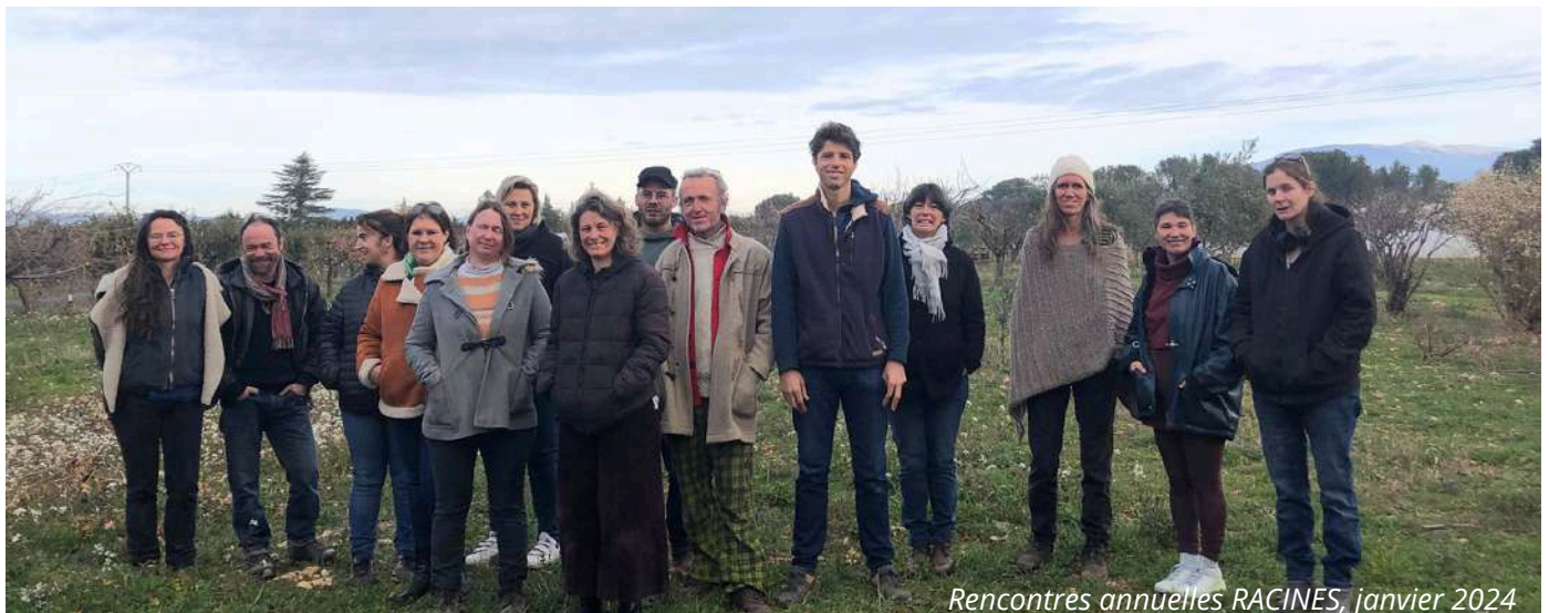
Rencontres annuelles RACINES, janvier 2024

L'année 2024 a été consacrée à la rédaction collective du livret national sur l'accueil pédagogique en s'appuyant sur l'enquête réalisée par la commission et diffusée auprès des adhérents CIVAM engagés dans des démarches d'accueil. L'objectif de cette parution prévue en 2025 : valoriser les expériences et compétences du réseau, et revendiquer les valeurs et le positionnement des CIVAM sur cette thématique.