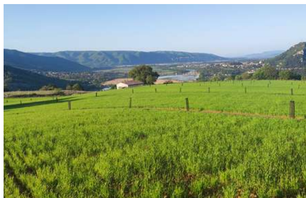
Agroforesterie intraparcellaire à Volonne (04), plantation financée par le marathon de la Biodiversité

Par ailleurs, le GR CIVAM est impliqué dans le cadre du "Marathon de la Biodiversité" financé par l'Agence de l'Eau RMC, qui porte notamment sur la plantation d'une quinzaine de km de haies autour de Digne-les-Bains (04). En 2024, le GR CIVAM PACA a formé 9 agriculteurs de l'agglomération "Provence Alpes Agglomération", puis accompagné individuellement 4 d'entre eux jusqu'aux plantations qui ont eu lieu à l'hiver 2024-2025. Ce travail se fait en lien étroit avec l'agglomération, le CEN PACA, la Chambre d'Agriculture 04 et la Scop Agroof qui intervient en binôme avec le GR CIVAM PACA sur l'accompagnement technique et la formation des agriculteurs.