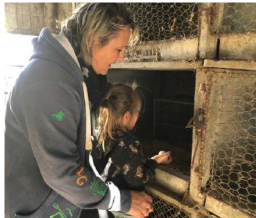
Accueil individuel SOS VE, mars 2024

SOS Villages d'Enfants : depuis 2022, une convention de partenariat a été mise en place avec SOS Villages d'enfants de Besse-sur-sur-Isole (83) pour développer l'accueil d'enfants confiés à l'ASE sur les fermes volontaires pour de courts séjours. En 2024, 50 des 55 enfants de la structure ont pu bénéficier de séjours sur les fermes du réseau soit l'équivalent d'1,5 enfant par jour placé sur une ferme. Plusieurs rencontres ont eu lieu en 2024 (temps convivial à Besse en janvier, journées collectives sur les fermes volontaires, bilan partagé à l'issue de la saison estivale...). Forts de la réussite de ce partenariat à l'échelle locale et de sa valorisation auprès du siège de SOS VE, une convention nationale de partenariat a été signée entre Réseau CIVAM et SOS VE France afin d'essaimer ces accueils sur d'autres territoires.