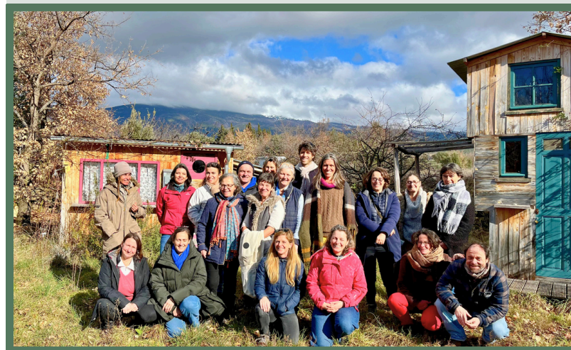
Ensemble, replantons les consciences